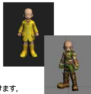
装備モデリング例

選考基準:キューエンタテインメントとDNC Entertainment社の厳選なる審査による。