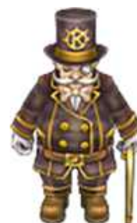
ギルド協会事務所長

XenepicOnlineでは初めてとなるユーザー動向の調査を2008年4月2日時点でのデータをもとに「ギルド協会事務所」が行いました。第1回目の調査となる今回は、「ワールド別のキャラクター分布」や「レベル分布」などの基本的なデータから、キャラクターの「戦闘不能回数」や「キャラクターの性別」などのマニアックな情報まで様々な角度からXenepicOnlineの「今」を分析しています。調査結果の一部をこちらに記載いたしますので、ギルド協会事務所長のコメントと共に楽しみくださいませ。