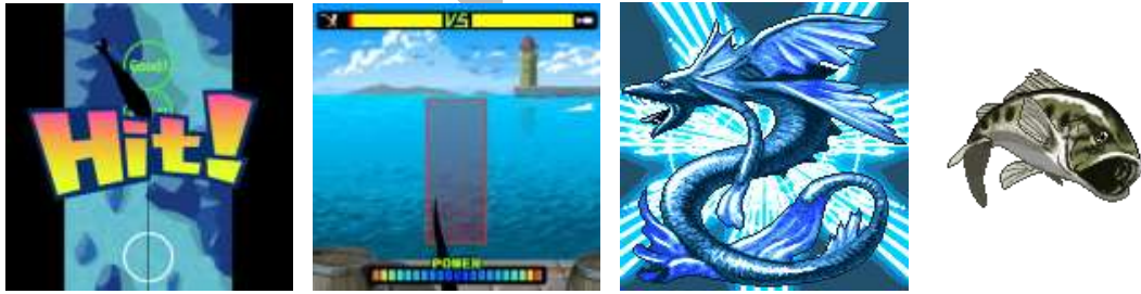
※ゲーム画面: 左から 釣り導入部分、釣り上げ動作、獲物例