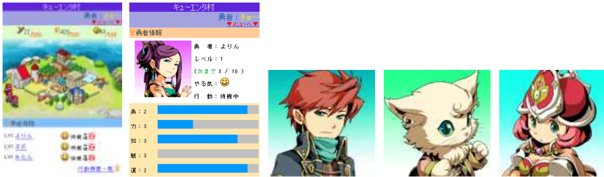
※ゲーム画面イメージ:左から村情報、勇者情報、ユーザーシンボル画像

自分の村を発展させて、勇者を育てるだけでなく、自分の村にともだちを勇者として迎え入れたり、ともだちの村を手伝ったりと、ともだちとの「ほどよい」繋がりが村の発展を助けるという、ソーシャルゲームとしての楽しみが盛りだくさん！