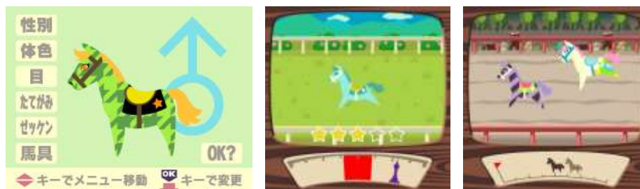
※ゲーム画面イメージ

ウマを自分好みにデザイン! ともだちとの協力で、より強くなる! レースでトロフィーをたくさんあつめよう! 調教やレースなど、本格的な競馬ゲームのコンテンツに加え、これまでの競馬ゲームとは全く違うカワイイデザインのウマたちと、ソーシャルゲームならではのともだちとの協力プレイがオモシロい、まったく新しいウマ育成ゲームです。