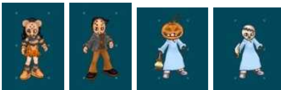
右から:ホラーセット(女)、ホラーセット(男)、パンプキンヘッド&ランタン、割れたどくろ&大ナタ